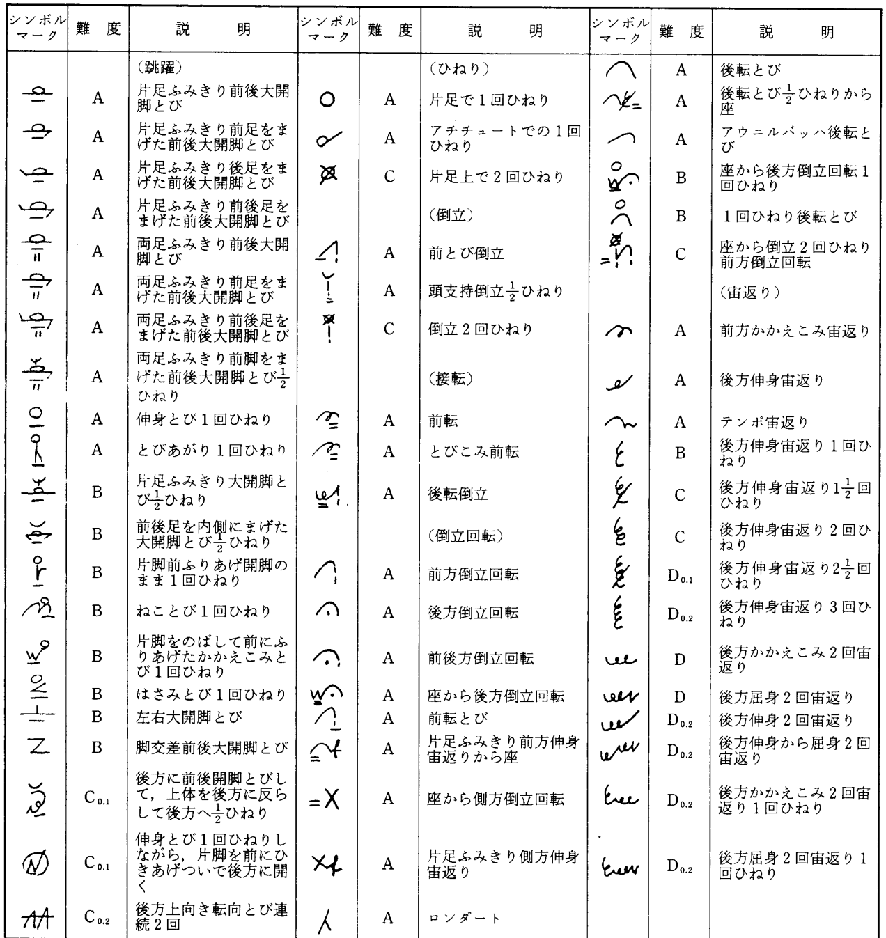
表1 シンボルマークの技と難度, 加点

である。アルファベットの横に記した数字は独自の加点といい、国際体操連盟により、技そのものに与えられる点である。表2は、ゆか運動における採点規則 2) を示したものである。体操競技は加点の0.4を含めて10点から減点法により採点される。ここに記した以外にも細かい規則が定められている。表3は種目別選手権に入賞した6名(以後入賞者と記す)とこの大会に出場した日本選手6名のゆか運動における技